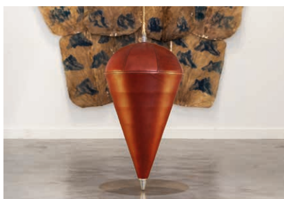
Blandine Brière, Deport de poids , 2021