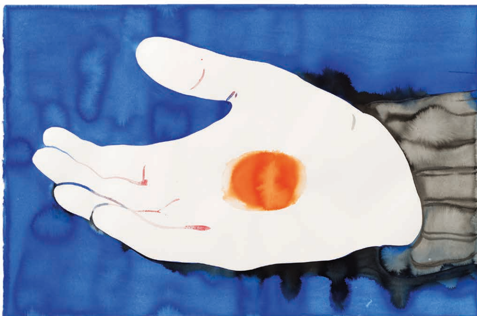
Françoise Pétrovitch Sans titre , 2022, © A. Mole © Semiose, Paris

Ses œuvres figurent dans de multiples collections publiques et privées, notamment le Centre Pompidou (Paris), le Museum Voorlinden, Wassenaar (Pays-bas), le National Museum of Women in the Arts, à Washington DC, le Musée Jenisch, Vevey (Suisse), les musées d'Art moderne et contemporain de Saint-Étienne et de Strasbourg, le MAC VAL, de nombreux FRAC, ainsi que les Fondations Salomon et Guerlain, le Fonds Hélène et Édouard Leclerc et le Fonds de dotation Emerige.