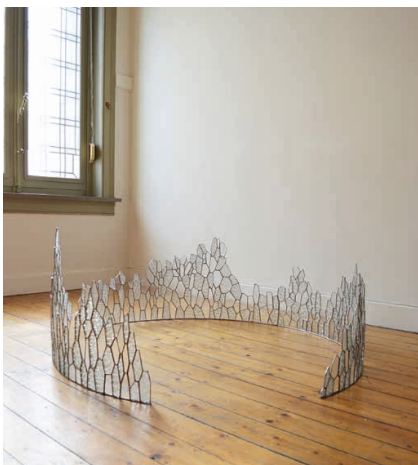
Laure Forêt, Erosion , 2018 © Laure Forêt