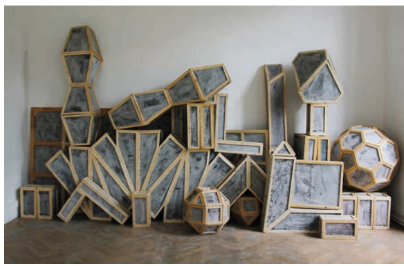
Ladislav Combeuil, Formes en transit , Diplôme 2015-Esba Talm Angers