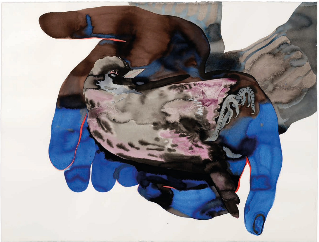
Françoise Pérovitch Sans titre , 2022, © A. Mole © Semiose, Paris