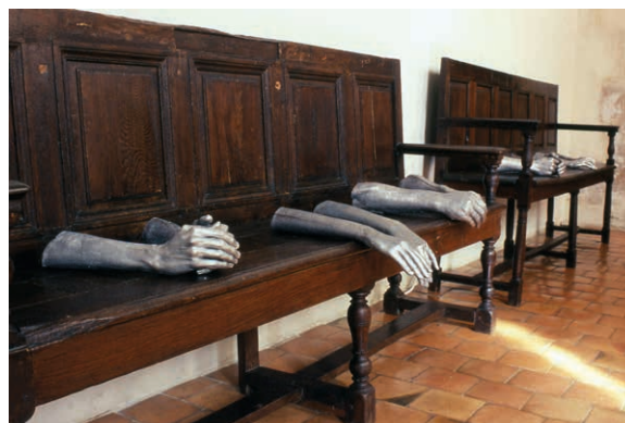
Manon Tricoire, Veillez bien souffrir cette attente , 2004, Musée de l'Hospice Saint-Roch, Issoudun, © Manon Tricoire