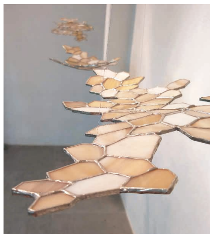
Laure Forêt, Lagunes , 2019 © Laure Forêt