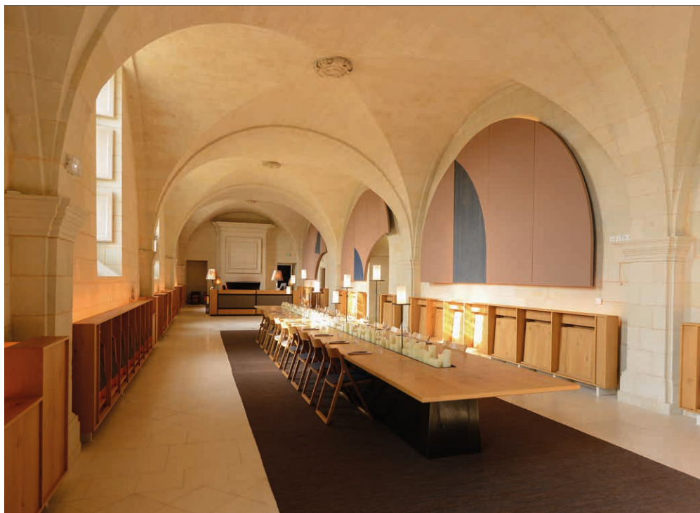
Petit refectoire, Fontevraud l'Hôtel et le Restaurant