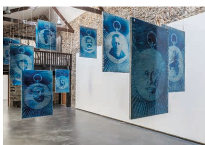
Blandine Brière, Les Chantres Le Voyage à Nantes, L'Atelier, Nantes, 2020