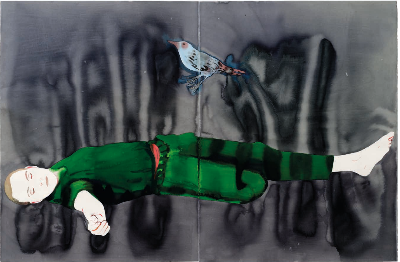
Françoise Pérovitch Étendu , 2022, © A. Mole © Semiose, Paris