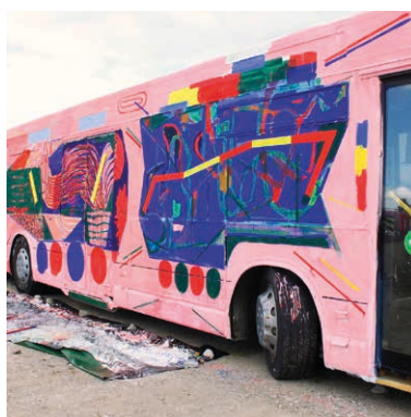
Geoffroy Pithon, Slow Bolide Monument .